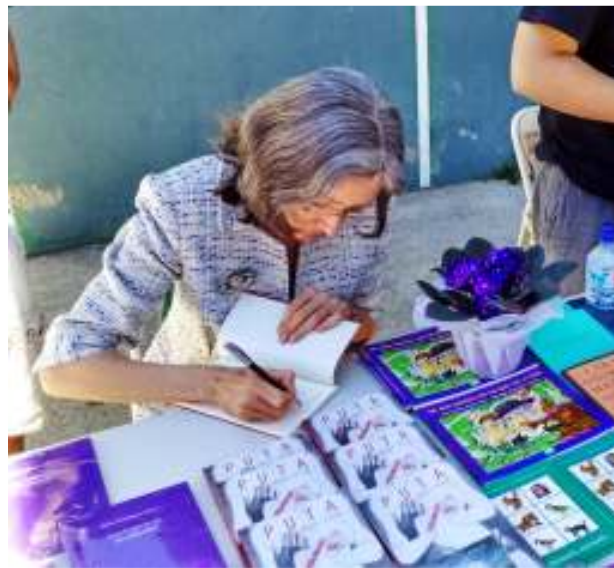
Firmando ejemplares en el IX Encuentro de escritoras aragonesas Brioleta, en Yésero (Huesca).

El poemario ha llegado a la congregación de Hermanas Oblatas del Santísimo Redentor. Ellas son mujeres especiales, sensibles al dolor ajeno, en especial al de las mujeres que se encuentran en situación de prostitución. Conviven con el sufrimiento cotidiano y la injusticia que padecen.